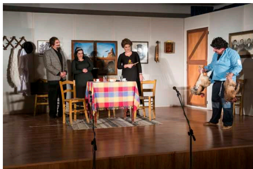
Σκηνές από το έργο «ΧΩΡΕΤΕΣ»