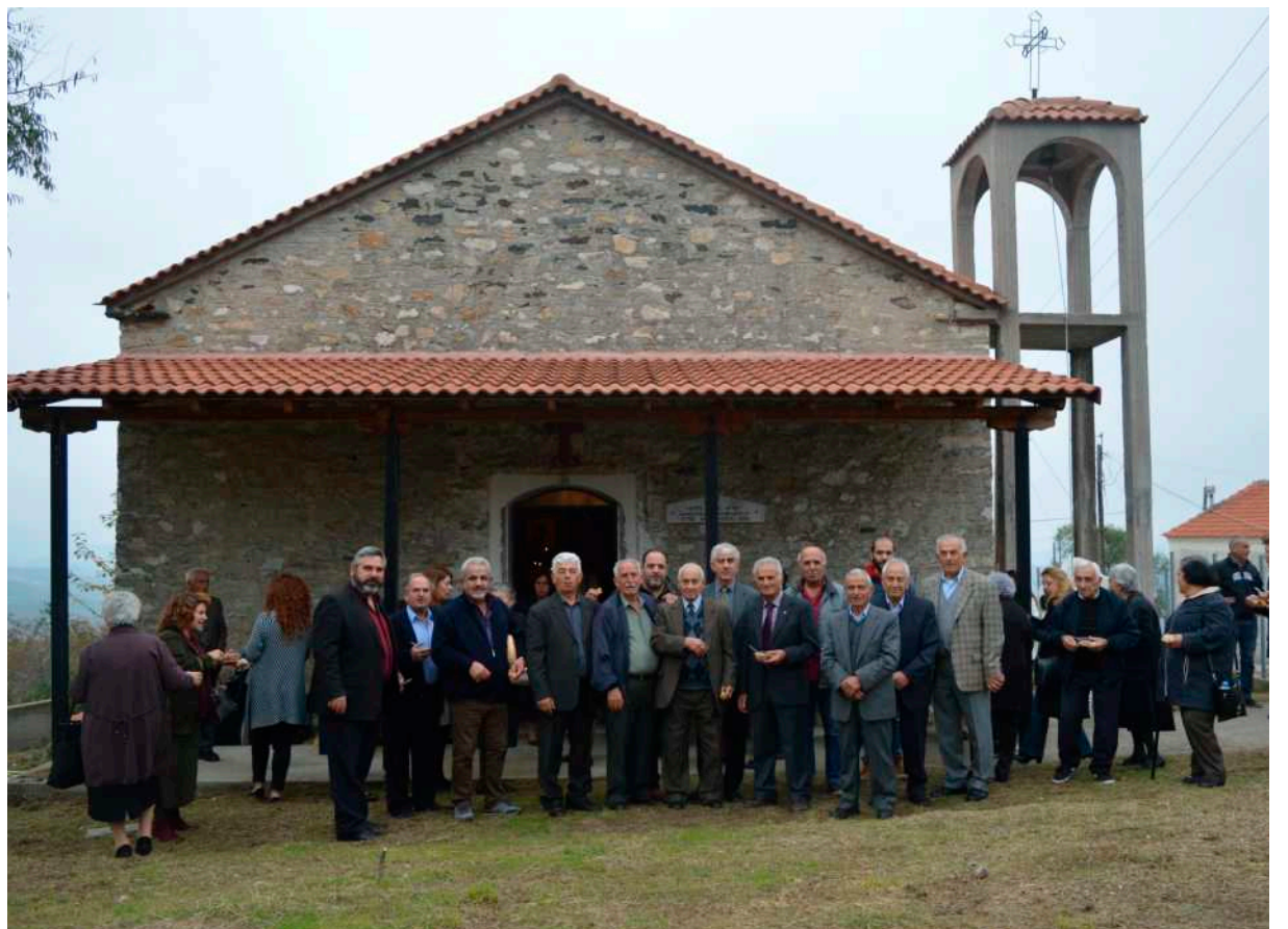
Προσκυνητές που τίμησαν τον Άγιο Δημήτριο, σε αναμνηστική φωτογραφία στον αύλειο χώρο του Ι. Ναού.