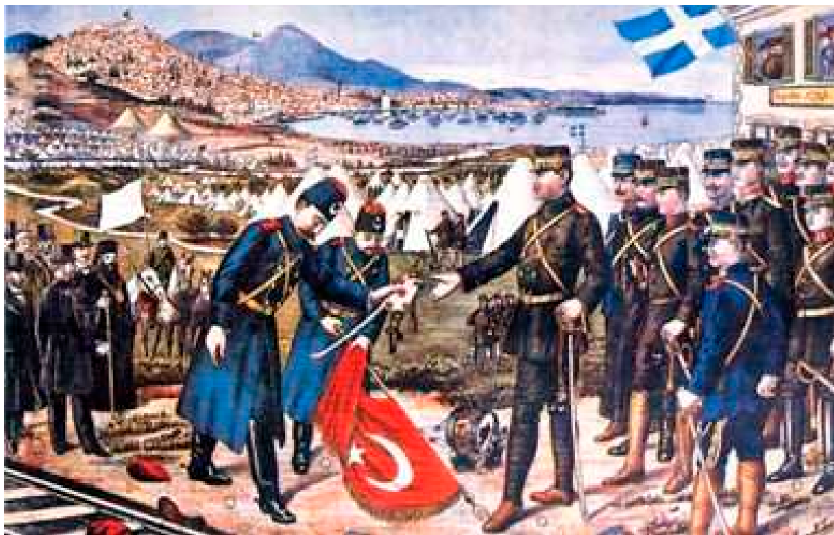
26 Οκτωβρίου 1912: ο Ταξίν Πασάς παραδίδει την Θεσσαλονίκη στον διάδοχο Κωνσταντίνο.